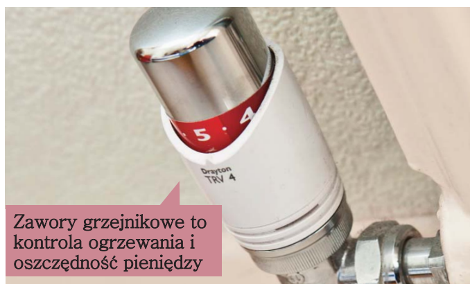
Zawory grzejnikowe to kontrola ogrzewania i oszczędność pieniędzy

Całkowite wyłączenie kaloryferów na kilka tygodni czy dłużej nie jest z reguły zalecane, ponieważ w bardzo zimnych pokojach może wytworzyć się wilgoć i pleśń. Kaloryfery w nieużywanych pokojach powinny być ustawione na niskim poziomie. Należy także zamknąć drzwi do tych pomieszczeń, aby nie uciekało tam powietrze z ciepłych pokoi.